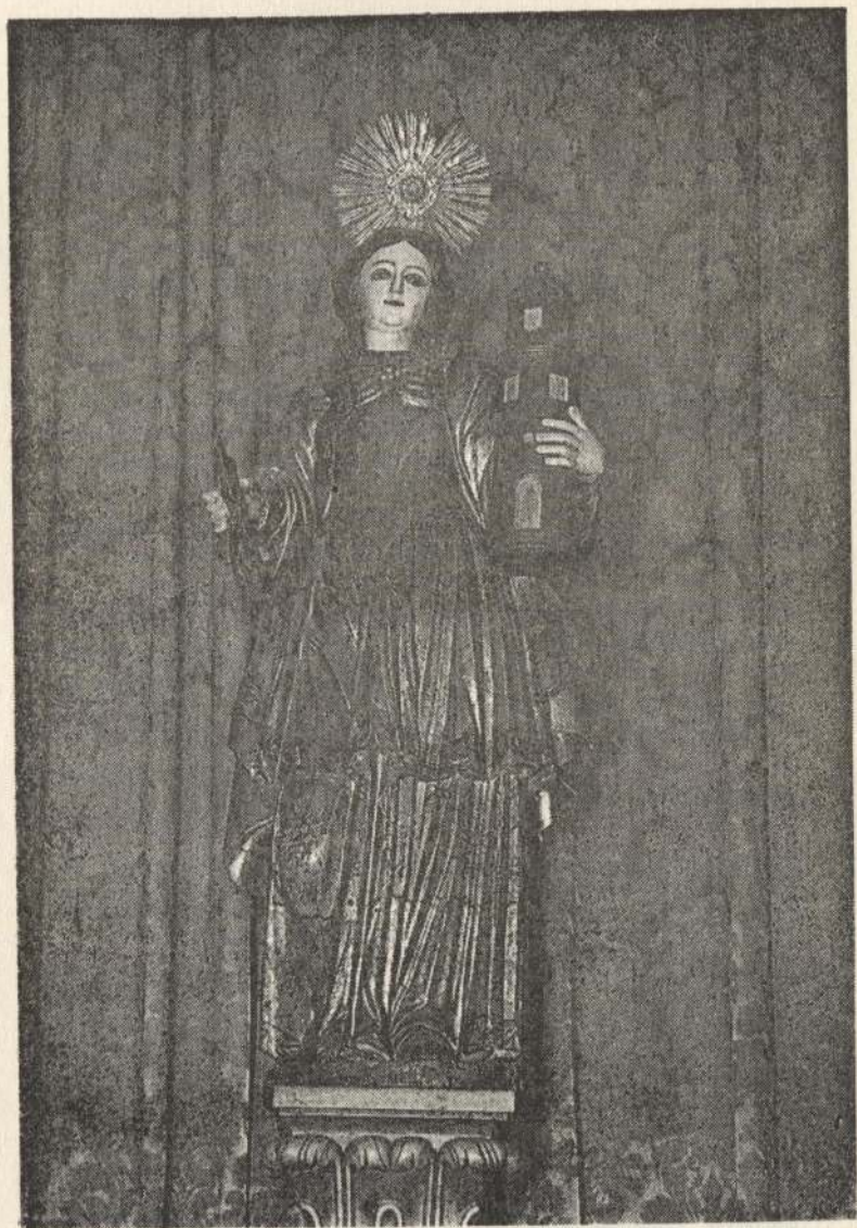
Imagem de Santa Bárbara (Igreja paroquial)