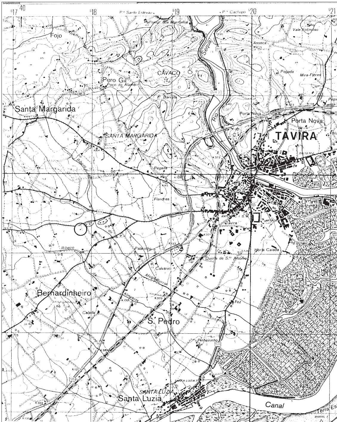
Fig. 1 Localização do achado de Bernardinheiro (seg. C.M.P., n.º 608, 1980).