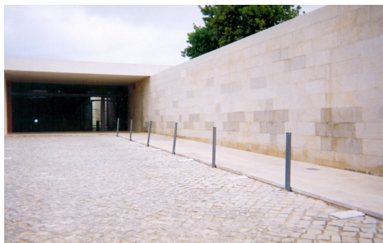
Figura n.º 168: O Centro de Acolhimento e Interpretação das Ruínas de Milreu.

A exposição permanente prima pela diversidade de materiais expositivos apesar de sumária. Contudo, consegue-se entender globalmente, a riqueza patrimonial do sítio: