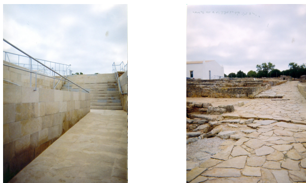
Figuras n.º s 166 e 167: Os acessos internos das Ruínas de Milreu.

O Centro de Acolhimento e Interpretação, possui, na nossa perspectiva, excelentes condições, à semelhança dos sítios arqueológicos de Miróbriga ou de São Cucufate, em Santiago do Cacém e Vidigueira, respectivamente. No início do percurso exterior, existem rampas pensadas para responder às necessidades específicas de determinado perfil do turista/visitante; no entanto, terminam ao chegarmos ao circuito. Assim sendo, os turistas de mobilidade reduzida só poderão entrar no Centro de Acolhimento e Interpretação, e em parte do circuito interno, tornando-se demasiado complicado a observação do mesmo.