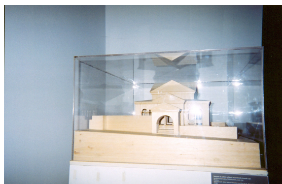
Figuras n.º s 169 e 170: Exposição permanente das Ruínas Romanas de Milreu

Quanto à estrutura de apoio ao turista/visitante, verificámos excelentes condições sanitárias para todo o tipo de utilizador e acessos adequados para os mesmos.