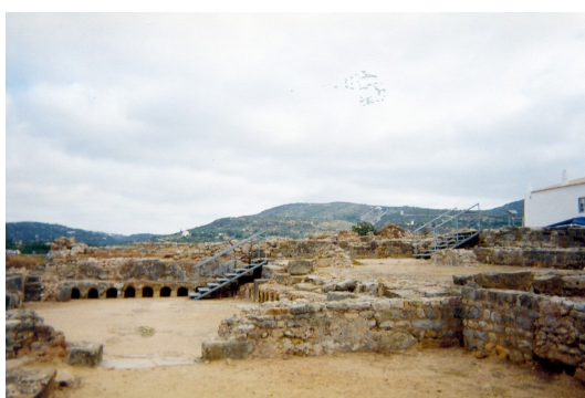
Figura n. ° 171: Percurso das Ruínas de Milreu.

No segundo ponto, visitámos os banhos com todas as suas componentes que apesar de facilmente perceptíveis no terreno, são explicadas em placas.