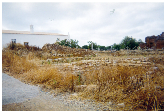
Figura n. ° 165: Envólúncia das Ruínas Romanas de Milreu

A envolvência do monumento é afectada não só pela circunstância de se encontrar rodeado de pequenas indústrias como também pelo facto de se observarem detritos e terras removidas de trabalhos arqueológicos recentes