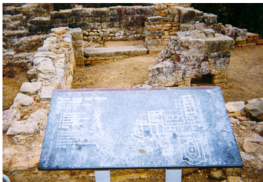
Figura n. ° 172: O painel explicativo dos vestígios romanos das Ruínas de Milreu.

Existem, igualmente, placas direccionais, setas vermelhas indicando o rumo que o turista/visitante deverá seguir, de forma a efectuar todo o circuito estipulado.