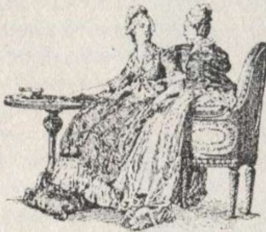
Duas sécias (gravura da época).

Se o Anatomico Jocosso nos deixou da «frança» de 1750 pequeninos retratos que são verdadeiros quadrinhos de Greuse ou de Watteau, o Theatro de Figueiredo e os folhetos de cordel dos res de 1780 a ram-nos a cariçiosa da «sécia», cência ainda da «frança», carácter de fiximanteve o tipo A «sécia», ao «frança», não é zação dum tipo mais o nome