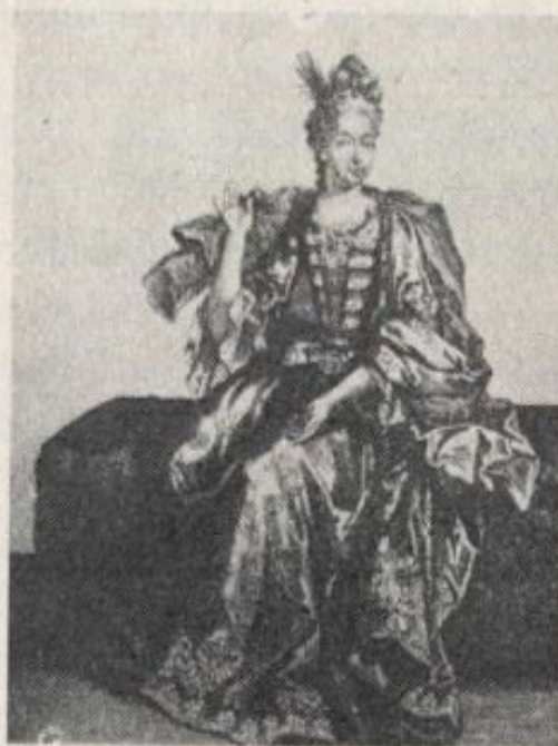
Uma frança do tempo de D. João V: rosicler, sinais de tafetá, pose grega.

Brun. A mesma de alongar o dominara na ta de Guia de na moda francesa da Brichota : o ga-se em bico os braços pare-cintura estreitís-traste com a da do donaire, sobre os cabe-colo, sobre as darra» mal pode lece, tem de se