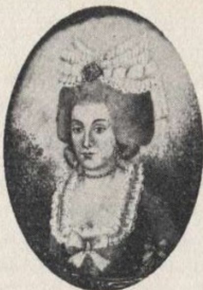
Uma frança da primeira metade do século XVIII.