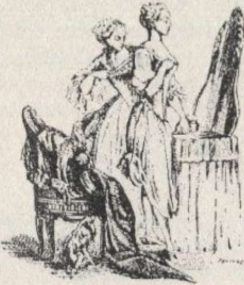
O toucador de uma sécia (gravura da época).

males de que ande que sejam mentito por afectar dores de cabeça, sempre dois par- Era tão galante, para a «françã» estado no Paço a el-rei, como conpadezia de rinos». A moda gante portuguese-século XVIII o quanto ela qui-