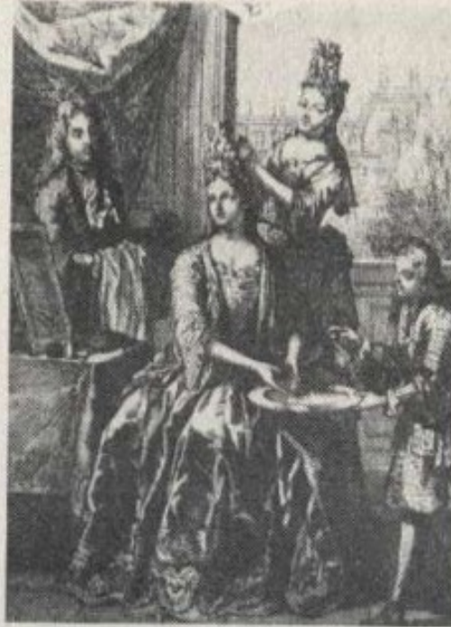
A toilette de uma sécia: o penteado e a água-às-mãos.

agora, que com o gria tudo se crê da nos crimi- é que o esplentes, a carnação exuberante dos lhada de pós da queada de sinais, que as mercutura de cordel, e transparente foi, te sucedeu, banifemininas de seguiu deixar em ção... mais do