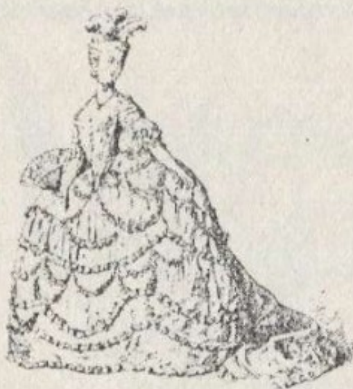
A saia de bambolins.

carmim da face, cada um com o seu nome galante – o beijocador , o melindroso ; uma saia, com palatido frio, um grande manto descia mais ombro esquerdo, broche no pescoço , em cor-de-dão negro cruz esmeraldas, um rosicler irmão da luvas de pala e cruz no topete,