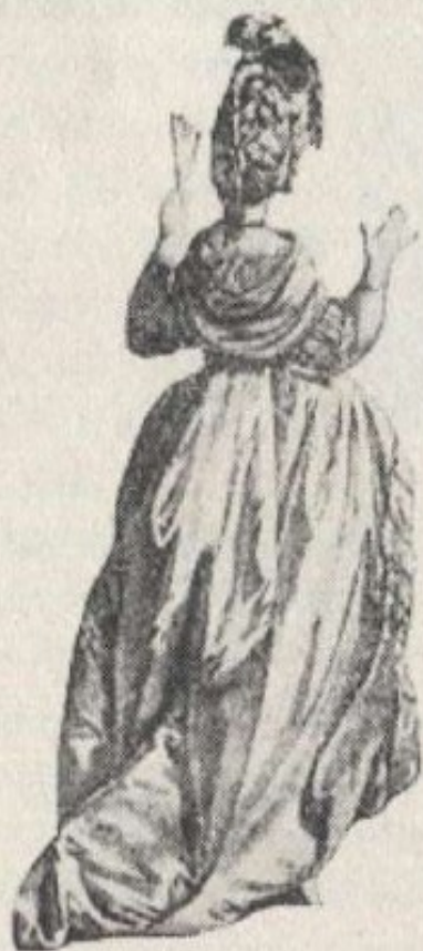
Uma elegante do tempo de D. Maria I: a écharpe e o penteado de trouxas.

nhas do tempo, com os galantes ajoelhados às portinholas, suplicando um sorriso, uma flor, uma palavra. Nas modas, como nos usos, a «francesia» acentua-se. D. João V manda vir tudo de França, desde as cabeleiras até às camisas. O delírio da imitação de Luís XIV abre definitivamente as portas aos figurinos franceses. A moda espanhola, com as suas golinhas, os seus mantéus, o seu tafetá modesto, o seu veludo negro solene, desaparece de todo mesmo nas camadas mais baixas – e o tipo caricatural, lisboeta, precioso, verdadeiramente adorável da «frança» surge nos serões do Paço, nas missas de S. Roque, nos sermões da Graça e nos arcos do Rossio, como o retratam minuciosamente as Turinas , ou