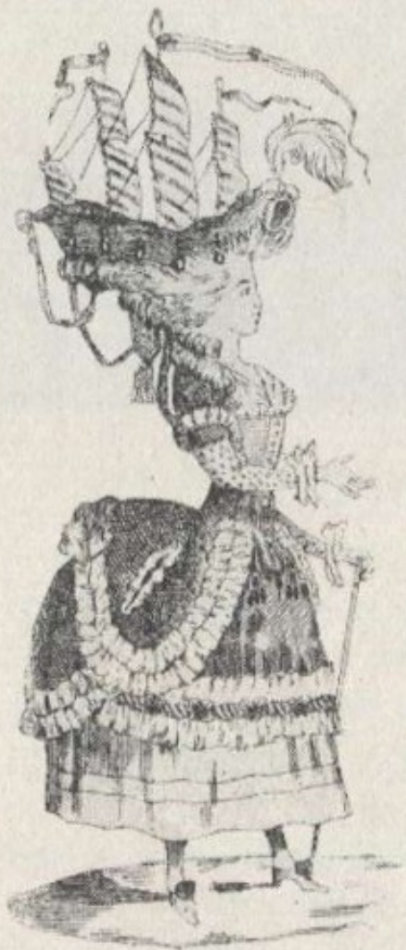
O penteado à la belle poule, segundo uma caricatura portuguesa do século XVIII (Litografia de Manuel Luiz).