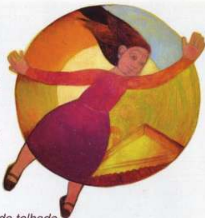
A Maia que voou do telhado