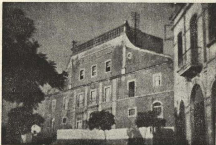
COLÉGIO DE S. TIAGO MAIOR, DA COMPANHIA DE JESUS, em Faro (hoje Teatro Letes), a mais importante das escolas que precederam o Seminário na formação do clero do Algarve.

1. A formação do clero foi sempre uma constante da história da Igreja. O próprio Senhor Jesus Cristo deu o exemplo educando os Apóstolos desde o começo da Sua vida pública. Os Apóstolos, apesar da acção especial do Espírito Santo nos primórdios da expansão da Igreja, fizeram o mesmo na escolha