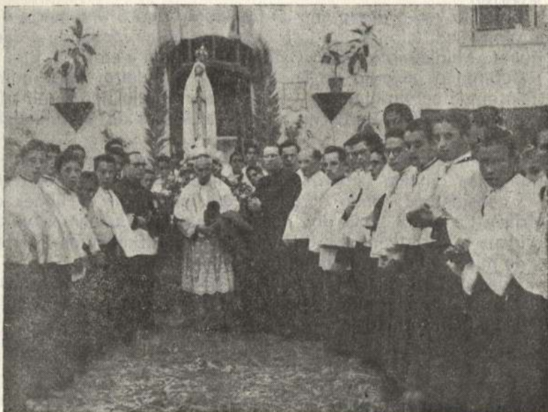
Seminaristas e professores recebem em «Jornada de Amor e de Glória» a visita da veneranda Imagem da Capelinha das Aparições, na sua vinda ao Seminário, em Dezembro de 1947

1933, a Sagrada Congregação dos Seminários instou para que se mandassem os alunos de Filosofia e Teologia a estudar no Seminário Regional, fomos muitos os que rejubilámos, esperando que os nossos padres viessem melhor formados. Hoje, porém, comparando os resultados, temos de reconhecer que nem intelectual nem espiritualmente a média dos sacerdotes formados em Faro era inferior à dos que estudaram noutros Seminários: o que se sentiu foi um decréscimo posterior na percentagem das vocações