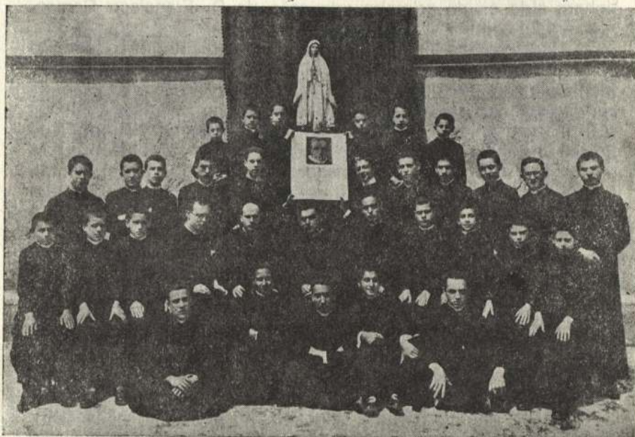
Em 1942, seminaristas e professores celebram as bodas de prata das Aparições de Fátima e a Ordnação episcopal de Pio XII. Demonstração da piedade mariana e da devoção ao Papa em que sempre foram educados os nossos seminaristas.

Apenas com uma média de sete padres a viverem (e não exclusivamente) para o Seminário, era possível atender à disciplina, à formação espiritual e às aulas tanto de Preparatório como da Filosofia e Teologia... E o aproveitamento tanto em qualidade