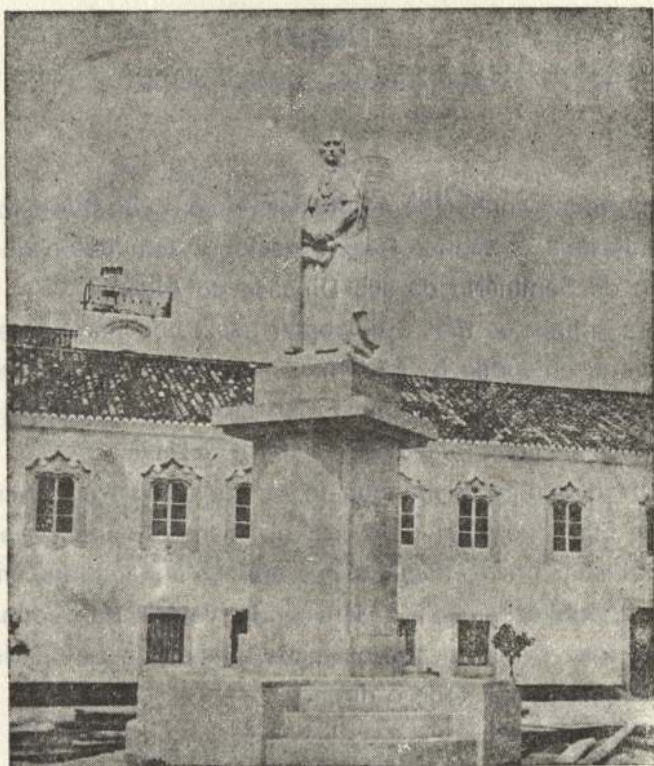
A estátua do Fundador do Seminário D. Francisco Gomes do Avelar inaugurada em 1940