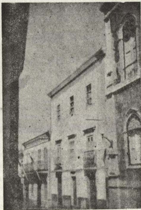
O SEMINÁRIO DA RUA DO MUNICÍPIO — Fachada da Rua do Município: no rés-ão-chão — camarata, Câmara Eclesiástica e quartos dos criados; no andar nobre: salas de visitas do Paço e do Seminário; no andar de cima: a camarata de 1924

1. A República maçónica instituída em 5 de Outubro de 1910 pôs imediatamente em vigor as leis anti-religiosas de Pombal e do Mata-Frades, agravando-as porém. Foram confiscadas as