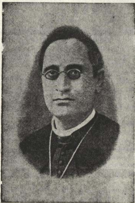
Nesta página e na seguinte, os dois mais ilustres alunos do Seminário de Faro: Cardeal D. José Sebastião Neto, Patriarca de Lisboa, e D. Marcelino António Maria Franco, Bispo do Algarve